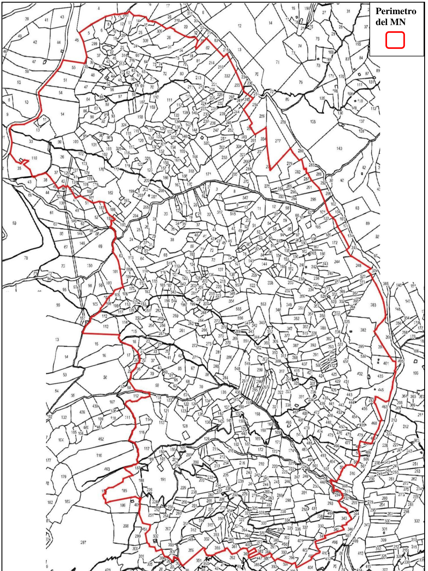
Perimetro del Monumento Naturale su base catastale in scala 1:10.000