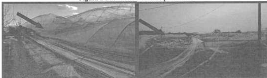
Figura 3 Danni a strutture produttive e manufatti