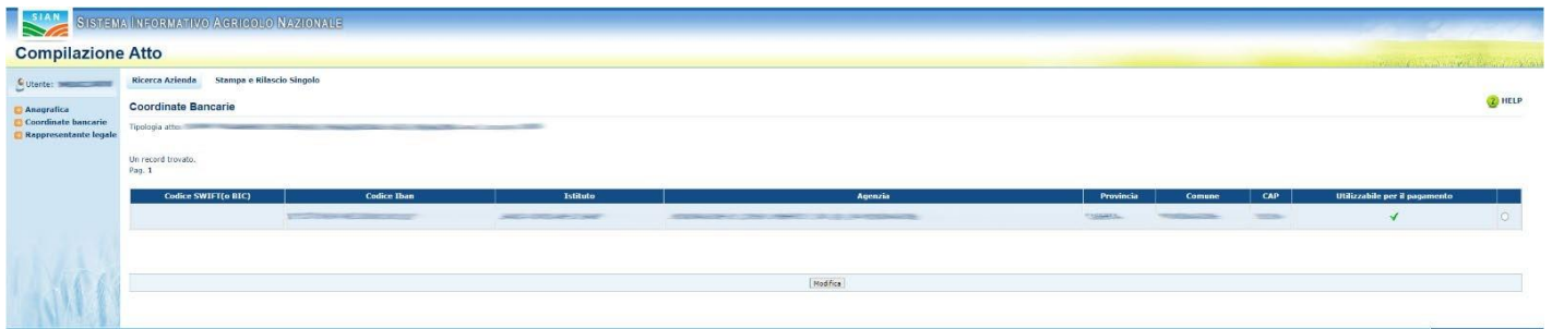
Figura 5 - Selezione di un c/c

Se la voce indicata non fosse corretta sarebbe possibile selezionare dalla lista di c/c disponibili tramite il tasto "Elenco c/c", come indicato dall'immagine seguente.