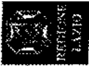
AMBITO TERRITORIALE N. 8