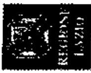
AMBITO TERRITORIALE N. 7