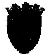
Comune di Roma