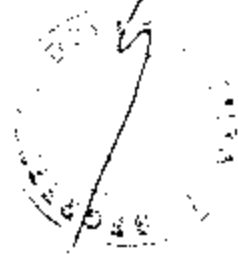
TABELLA N. 1