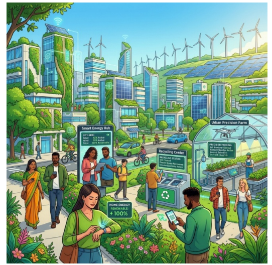
(Immagine generata con IA)

Costruire una città a misura di esseri umani significa quindi riconoscere la pluralità delle esperienze urbane e progettare spazi capaci di rispondere a bisogni reali e quotidiani. Ciò comporta maggiore sicurezza negli spazi pubblici, rafforzamento dei servizi essenziali, migliore qualità degli ambienti urbani e garanzia di un'elevata accessibilità per tutte le persone. In questa prospettiva lo spazio urbano diventa un luogo più equo, funzionale, inclusivo e ampio.