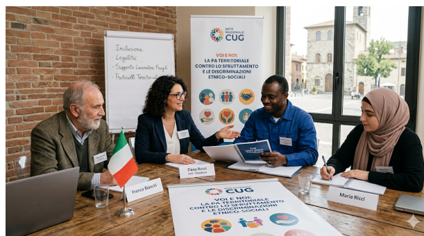
(immagine generata con IA)

La lotta allo sfruttamento e il superamento delle discriminazioni su base etnica richiedono un cambio di paradigma culturale. Onorare il mandato di garanzia dei CUG significa anche questo: fare in modo che la Pubblica Amministrazione sia percepita come una casa di diritti e di legalità accessibile a tutti, nessuno escluso.