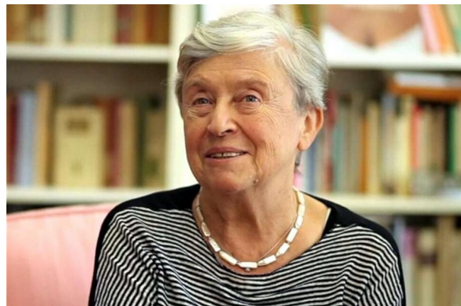
Luisa Muraro