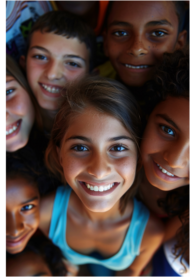
(immagine generata con IA)