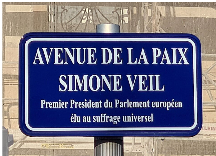
(Strasbourg-Avenue, Ji-Elle, CC-BY-SA-4.0, Wikimedia)

L'intera carriera di Simone Veil fu accompagnata da un crescente prestigio nazionale e internazionale e da una forte riconoscibilità mediatica. La sua vita rappresentò una fusione non comune tra dimensione pubblica e privata, tra impegno professionale e politico, che diede forma a un'identità personale straordinaria. Le