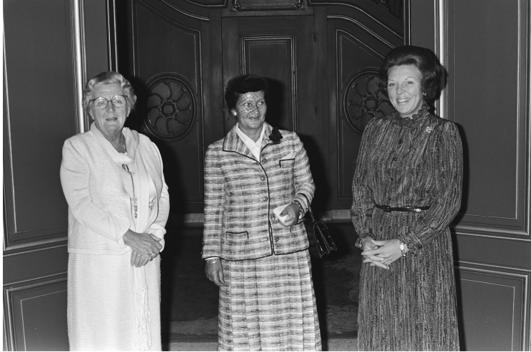
(La principessa Juliana, Simone Veil e la regina Beatrice, Rob Croes, Wikimedia) ,

«Per raccogliere le sfide lanciate all'Europa dovremo perseguire tre obiettivi: l'Europa della solidarietà, l'Europa dell'indipendenza, l'Europa della cooperazione. L'Europa della solidarietà anzitutto: della solidarietà tra i popoli, tra le regioni, tra le persone».