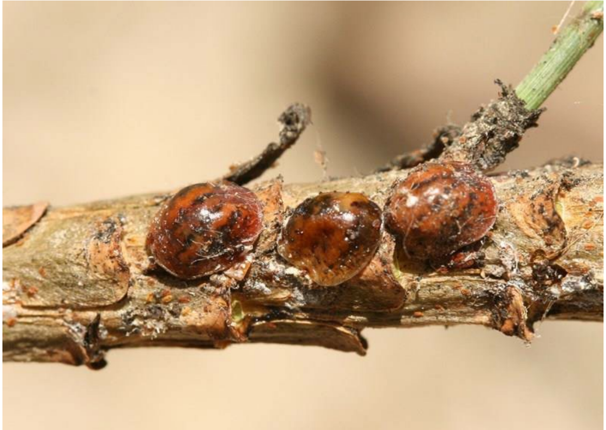
Fig. 1. Colonia di Toumeyella parvicornis su germoglio di pino domestico

Toumeyella parvicornis (Cockerell) è un insetto di origine americana, denominato Cocciniglia tartaruga del pino per la particolare morfologia del corpo delle femmine adulte, che ricorda un carapace di tartaruga, e perché vive sulle piante del genere Pinus .