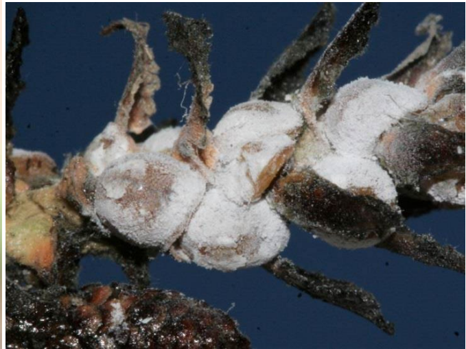
Fig. 2 Colonia con forme giovanili (neanidi) arancioni Fig. 3 Colonia ricoperta di cera