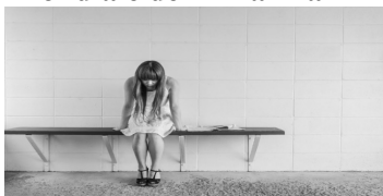
In foto: una ragazza in solitudine

Lo scorso anno l'UNICEF Italia ha dedicato questa giornata alla salute mentale e il benessere psicosociale dei bambini e degli adolescenti. Tema questo più che mai utile dal momento che nel mondo il suicidio è la quinta causa di morte per i giovani tra i 15 e i 19 anni, la seconda causa in Europa: parliamo di quasi 46.000 adolescenti che si tolgono la vita ogni anno – più di uno ogni 11 minuti.