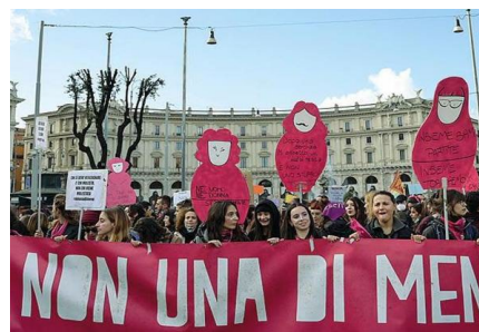
In foto: manifestazione contro la violenza sulle donne

Questo quanto riporta il report settimanale del Ministero degli Interni - Dipartimento pubblica sicurezza direzione centrale della polizia criminale Servizio Analisi Criminale.