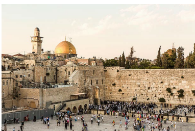
In foto: Gerusalemme -

La data scelta è quella della risoluzione adottata il 29 novembre 1947 con la quale si sancì la partizione della Palestina e la creazione di due Stati indipendenti, uno ebraico e uno arabo.