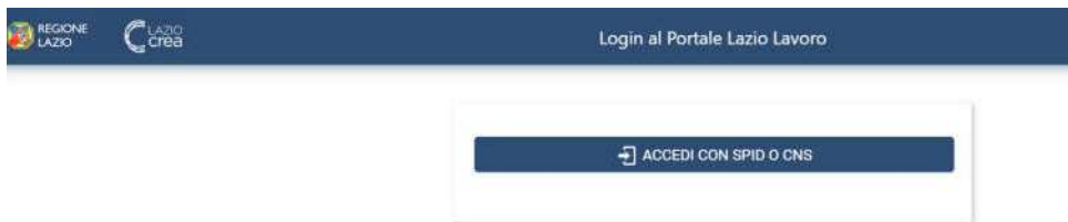
Figura 1 – Pagina di accesso al PLL

Terminata la configurazione si può accedere all'indirizzo web del PLL, sempre tramite SPID.